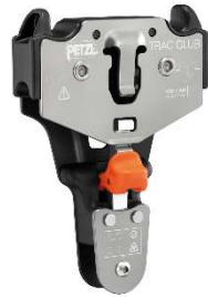
TRAC CLUB, cikkszám P023AB00

TRAC CLUB csigák (cikkszám: P023AB00 és P023AB01) visszahívása a törésveszély miatt, amely halálos balesetet okozhat. A visszahívásban érintett csigák használatát haladéktalanul függessze fel!